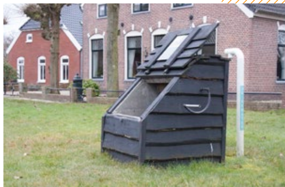
Herstel waterput Anloo