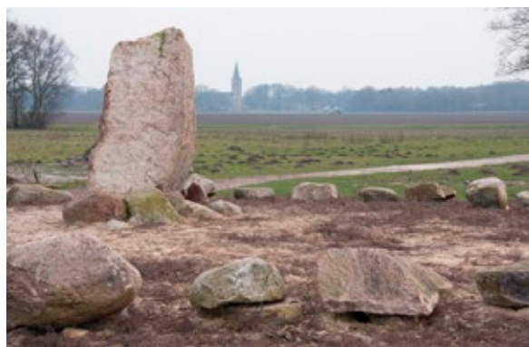
Kunstwerk 'Baak van het Ballooërveld'

de kans te geven de wegen op te gaan zijn faunarasters aangelegd (oranje stippellijn). Kort na de aanleg zijn al sporen van passerende dieren gevonden, waaronder een duidelijk spoor (in de sneeuw) van een vos door de droge duiker onder de Haarweg.