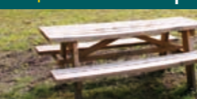
Levend bezoekersnetwerk 6