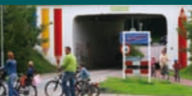
Dorp in beeld 4