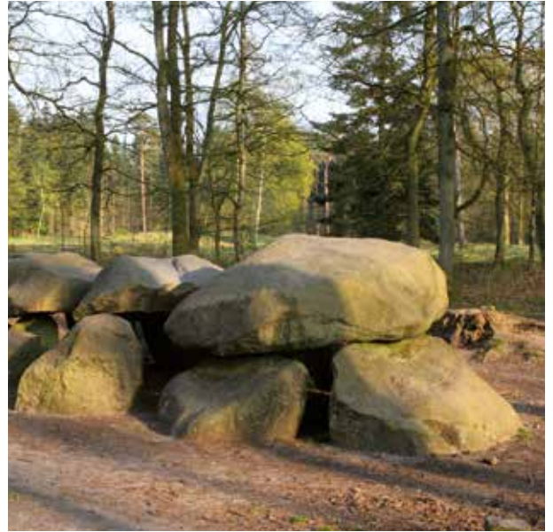
Hunebed D8. Oorspronkelijk lagen hunebedden op open plekken in het landschap.

Bij iedere stap die u in Strubben Kniphorstbosch zet, past een verhaal uit het verleden. Al vijftig eeuwen lang wonen hier mensen. Vanwege de historische rijkdom is het gebied nu een archeologisch reservaat. U vindt er hunebedden en grafheuvels op uw weg door bos en heide. Ook in de natuur zelf weerklinkt de echo van onze voorouders. De grillige eiken in de noordelijke Strubben werden ooit afgeknabbeld door het vee van middeleeuwse boeren. Vandaag getuigen de knoestige boomstammen van een strijd om het bestaan.