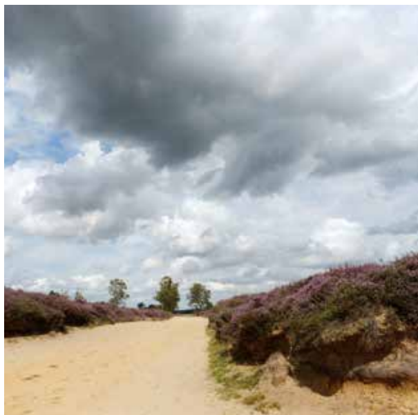
Het Ballooërveld heeft veel langgerekte paden op de heide.

Uitkijkend over het Ballooërveld maakt u kennis met het grootste heideveld van het Drentsche Aa-gebied. Hier is volop ruimte om te ademen. Terwijl u in de verte tuurt, speelt de wind met het losliggend zand van de stuifduinen. De natuur is opmerkelijk ruig en weids. Nergens zijn sporen van mensen te zien, behalve de kerktoren van Rolde die boven de bomen uitsteekt. Maar schijn bedriegt. Langgerekte banen door de heide verraden dat hier in de middeleeuwen een drukke verkeersroute lag. Ooit klonk hier het geknars van voorbijgaande boerenkarren.