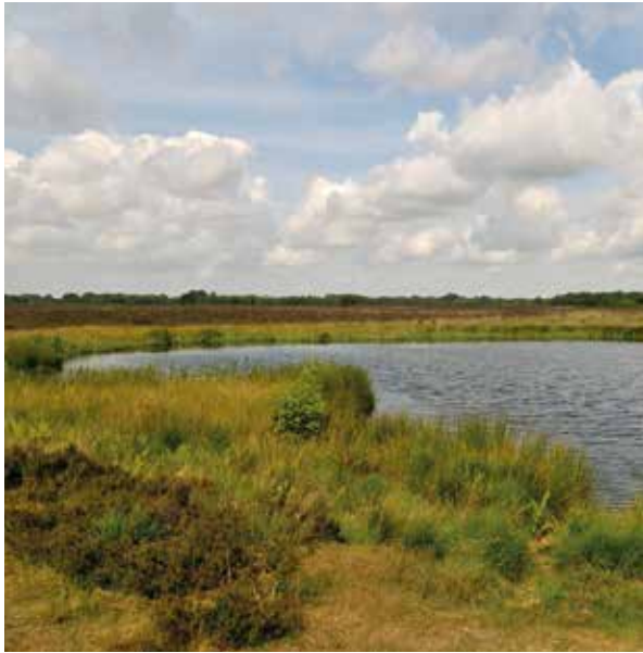
Een heidevennetje: oase op het droge zand