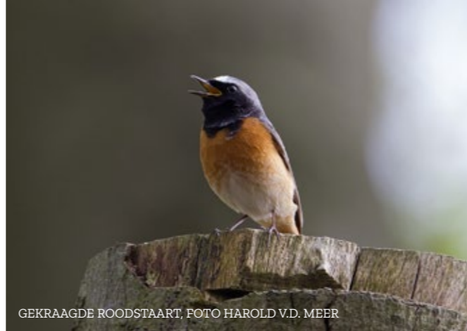
GEKRAAGDE ROODSTAART