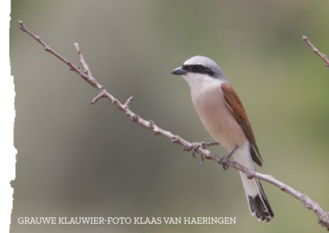
GRAUWE KLAUWIER-FOTO KLAAS VAN HAERINGEN