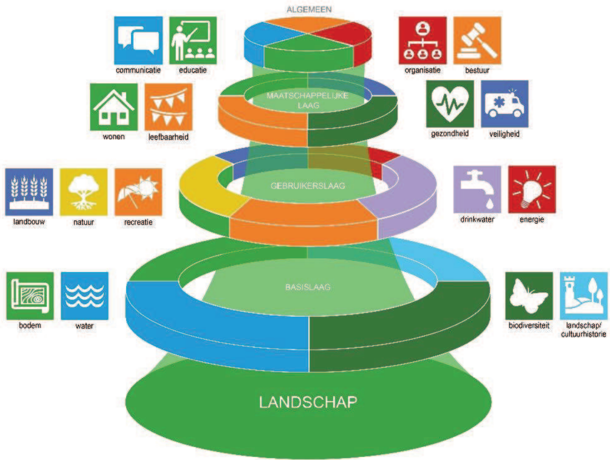
Figuur 1. Thema's in het NP Drentsche Aa